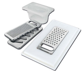
Satz Reibe mit Halterung für Ring und Auffangschale

* nur in Kombination mit dem Zubehör 8644 101