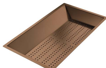
Perforierte Edelstahlwanne PVD Copper

* nur in Kombination mit dem Zubehör 8644 101